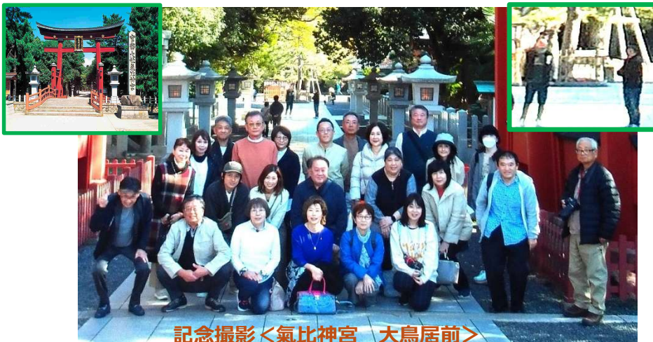
記念撮影<氣比神宮 大鳥居前>